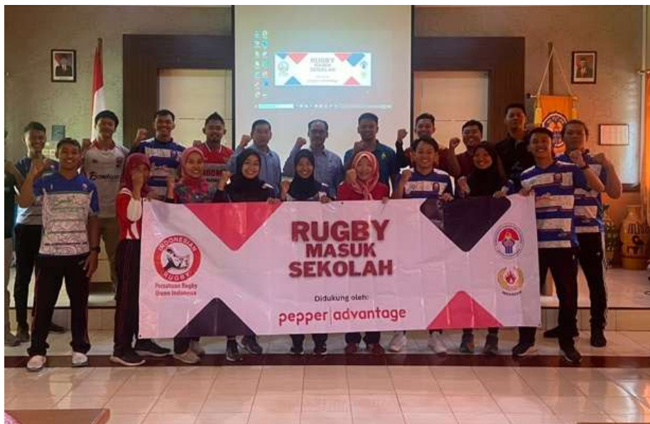
Gambar 2. Foto penyerahan bantuan bola dan Roadshow workshop program Rugby masuk sekolah

Program RMS disambut antusias oleh sekolah-sekolah mitra di Daerah Istimewa Yogyakarta. Dari masing-masing kabupaten/kota diberikan jatah merekomendasikan sembilan sekolah: tiga dari SD, tiga dari SMP, dan tiga dari SMA. Total ada 45 sekolah yang berpartisipasi aktif dalam Program Rugby Masuk Sekolah (RMS). Guru PJOK dan siswa menunjukkan minat tinggi untuk mempelajari olahraga baru yang aman dan edukatif. Seperti yang diungkapkan oleh salah satu guru PJOK peserta program, "Kami sangat senang bisa mengenalkan T1 Rugby di sekolah. Anak-anak menjadi lebih aktif dan semangat belajar, apalagi dengan konsep permainan yang aman." Sementara itu, seorang siswa SD peserta RMS menyatakan, "Awalnya saya takut olahraga rugby karena terlihat kasar. Setelah mencoba T1 Rugby, ternyata menyenangkan dan semua teman jadi kompak." Kehadiran suara langsung dari guru dan siswa ini memperkuat bukti bahwa penerimaan program berjalan positif di lapangan.