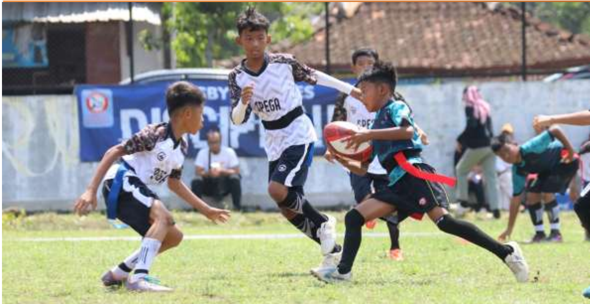
Gambar 3. Foto kegiatan festival Rugby Kelompok Umur 12