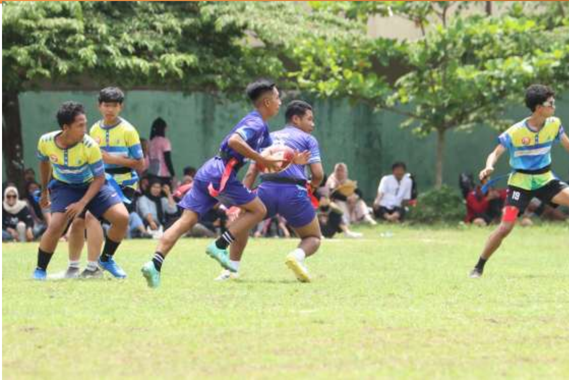
Gambar 5. Foto kegiatan Festival Rugby Kelompok Umur 18