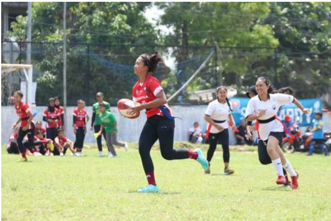
Gambar 4. Foto kegiatan Festival Rugby Kelompok Umur 15