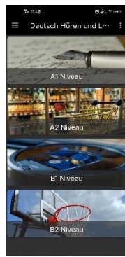
Gambar 3. Isi materi dari Aplikasi Deutsch Hören & Lesen