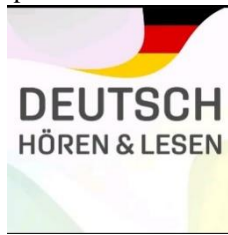
Gambar 2. Tampilan awal Aplikasi Deutsch Hören & Lesen