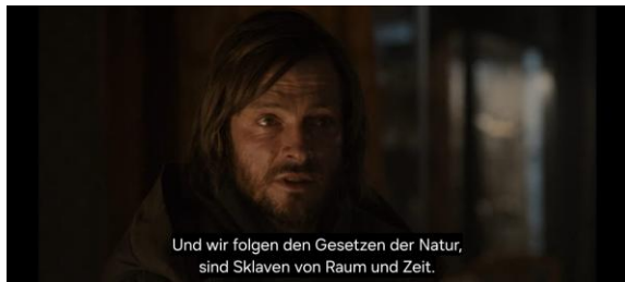
Gambar 4.24 Penjelasan Determinisme waktu

Wissenschaftler: “Aber Sie... was fasziniert Sie so an der Zeit?”