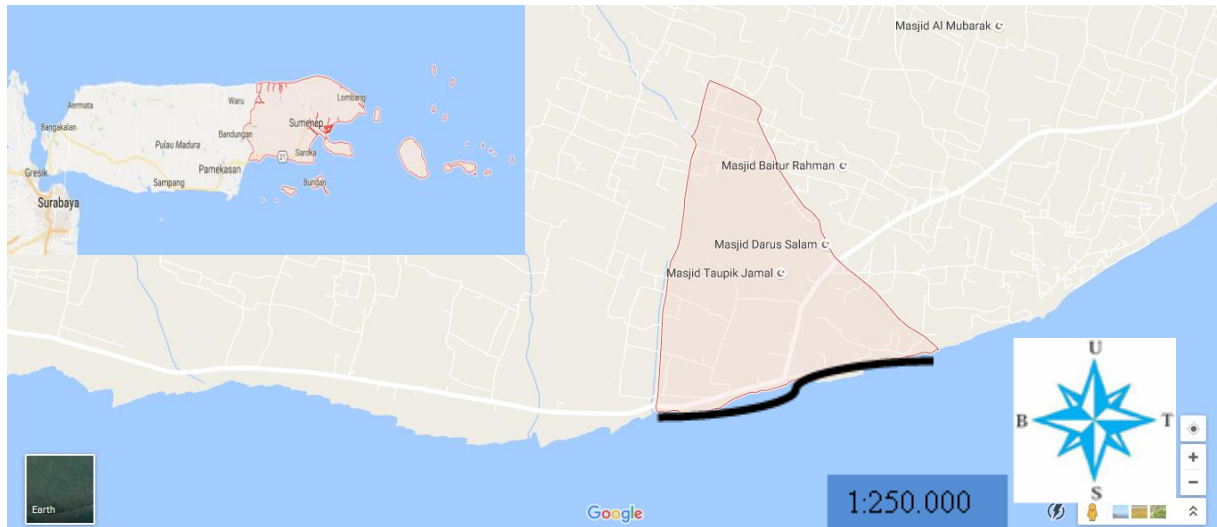
Gambar 1. Peta lokasi penelitian Pantai Barung Toraja Sumenep, Madura

terkait, Allen dkk (2012), Shih dkk (2015), Yaqin dkk (2017), Kemp (1919), Wong dkk (2011) dan alamat web http://species-identification.org/ .