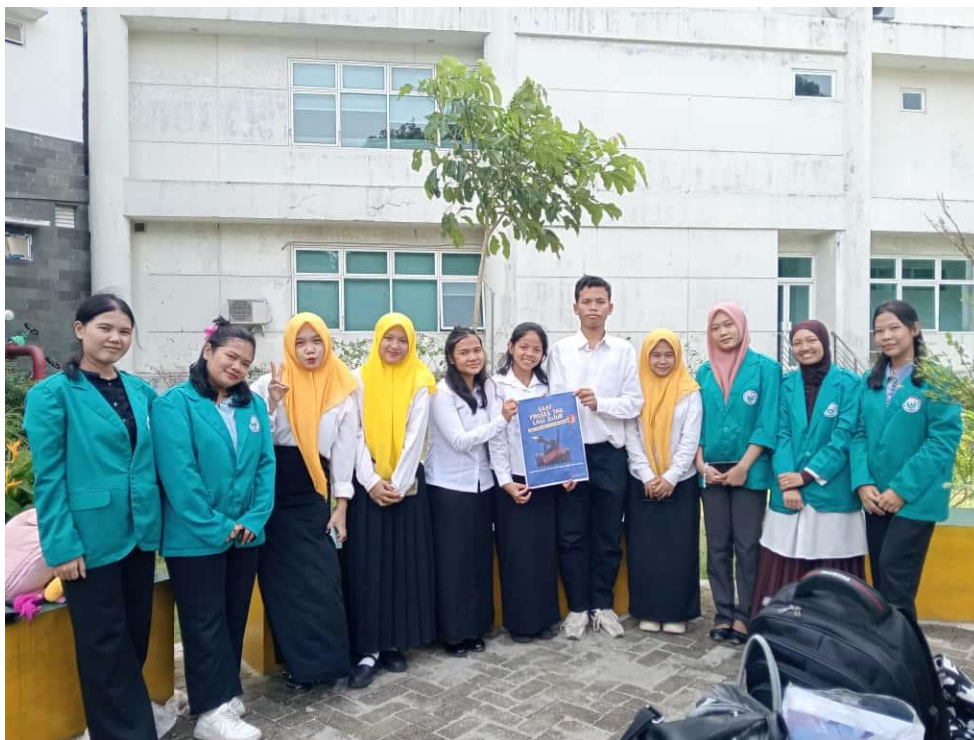
Gambar 1. Foto Bersama Audiens

Secara keseluruhan, pembahasan ini menegaskan bahwa nilai kerakyatan dalam bentuk musyawarah sudah dipahami dan telah diterapkan pada beberapa kegiatan organisasi mahasiswa, namun masih diperlukan sosialisasi lanjutan agar mahasiswa lebih kritis dalam melihat potensi penyimpangan ke depan. Data menunjukkan bahwa praktik musyawarah yang baik memang dapat menciptakan suasana yang inklusif, mengurangi konflik, dan memperkuat legitimasi keputusan organisasi. Dengan memperkuat pendidikan mengenai nilai kerakyatan sebagaimana ditegaskan oleh Putri, Cahyati, dan Pratiwi, mahasiswa dapat menjadi agen demokrasi yang lebih sadar, bertanggung jawab, dan berorientasi pada kepentingan bersama.