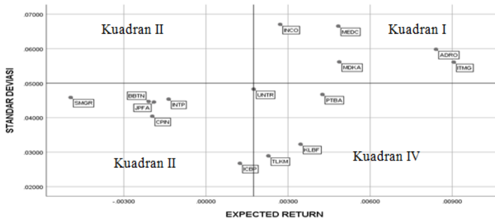
Gambar 2. Grafik Menggunakan Analisis Tipologi Klassen

Berdasarkan Gambar 2 pada kuadran II tidak terdapat saham sehingga diperoleh tiga portofolio yang dapat dilihat pada Tabel 2.