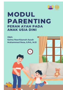
Gambar 1. Sampul Modul Parenting

keterlibatan ayah dalam kegiatan parenting maupun pengasuhan anak masih relatif rendah. Selain itu, belum tersedia media edukasi yang secara khusus membahas pentingnya peran ayah dalam pengasuhan anak usia dini. Berdasarkan kebutuhan tersebut, peneliti mengembangkan modul parenting yang berisi materi mengenai pentingnya keterlibatan ayah dalam perkembangan anak, bentuk-bentuk keterlibatan ayah dalam kehidupan sehari-hari, manfaat keterlibatan ayah bagi perkembangan anak, serta strategi yang dapat dilakukan ayah dalam mendukung tumbuh kembang anak usia dini.