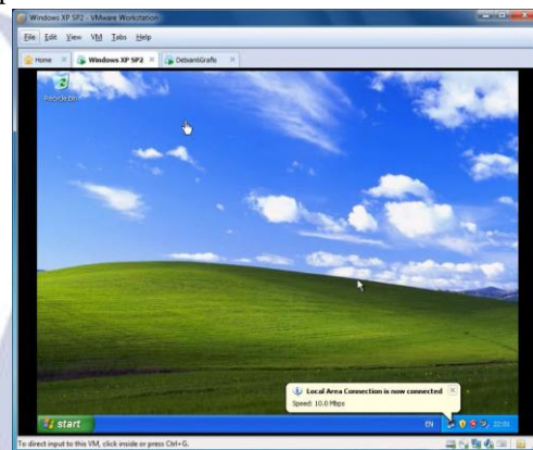
Gambar 3 Media Komputer Virtual

Perangkat dan media pembelajaran hasil perancangan awal disebut sebagai Draf I Perangkat terdiri dari silabus, RPP, LKS, buku siswa, buku guru, lembar penilaian, dan video. Komputer virtual berupa software aplikasi produk siap pakai merupakan media penunjang bagi perangkat lainnya. Perancangan perangkat dan media telah dibuat dengan melakukan melalui studi mandiri, studi literatur, melakukan konsultasi kepada dosen pembimbing, dan mempertimbangkan pemilihan media dan model pembelajaran yang sesuai. Gambar 3 merupakan tampilan dari media pembelajaran dengan komputer virtual dan Gambar 4 adalah kumpulan video yang dikemas dalam slide presentasi.