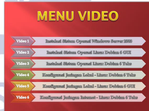
Gambar 4 Media Video dalam Slide Presentasi