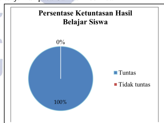
Gambar 2 Diagram Ketuntasan Hasil Belajar Siswa

Berdasarkan Tabel 6 diatas, dapat diketahui persentase jumlah siswa yang hasil belajarnya tuntas. Persentase jumlah siswa yang hasil belajarnya tuntas ditunjukkan pada Gambar 2 berikut.