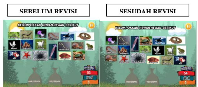
Gambar 2. Gambar hewan diletakkan secara berurutan

Pelaksanaan penelitian yang dilakukan pertama kali adalah melakukan telaah terhadap Media Game Classification of Kingdom Animalia yang dilakukan oleh dosen ahli media dan guru IPA kemudian dilakukan validasi terhadap media. Adapun saran-saran dari penelaah adalah: