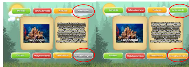
Gambar 4. Kesalahan penulisan pada kata Athopoda dan Nematehelmyntes