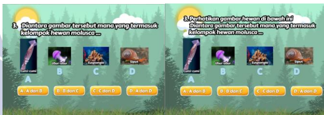
Gambar 6. Petunjuk soal kurang jelas