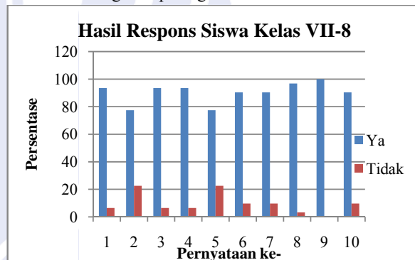
Gambar 2. Hasil Respons Siswa Kelas VII-8

Adapun hasil angket respons siswa kelas VII-8 dapat dilihat dalam grafik pada gambar 2.