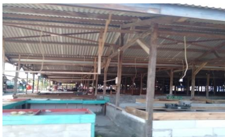
Gambar 5. Pasar Buah di Penjara Koblen Surabaya

Dari pihak masyarakat sendiri juga masih kurang rasa akan memiliki dan kesadaran untuk melindungi Bangunan Cagar Budaya Bekas Penjara Koblen karena masyarakat hanya diam saja dengan budaya melanggar aturan. Serta, tidak ada aparat secara khusus yang menjaga Bangunan Cagar Budaya dan hanya dari pihak pengelola saja yang biasanya dijaga oleh satpam.