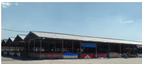
Gambar 4. Pasar Buah di Penjara Koblen Surabaya