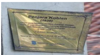
Gambar 1. Plakat Cagar Budaya Bekas Penjara Koblen

Kemudian lapak tersebut direnovasi menjadi lebih besar dan rapi sehingga mengutamakan pada konsep kenyamanan dan keamanan bagi konsumen pasar. Izin operasi pun diluncurkan oleh Pemerintah Kota, namun hal yang tidak diperhatikan adalah pelestariannya bahkan justru kondisi bangunan Cagar Budaya seperti atap menara, genteng, dan kayu yang sudah hampir roboh.