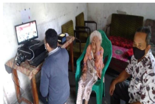
Gambar 8. Perekaman e-KTP Pada Warga Lanjut Usia