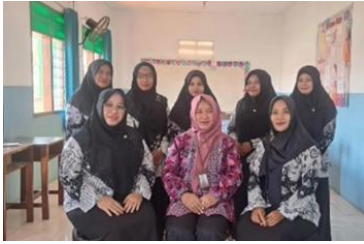
Gambar 6 Pengawasan oleh Pengawas Sekolah SD Insan Mulya

Pelaporan berkas dan kelengkapan berkas selalu di cek oleh pengawas.