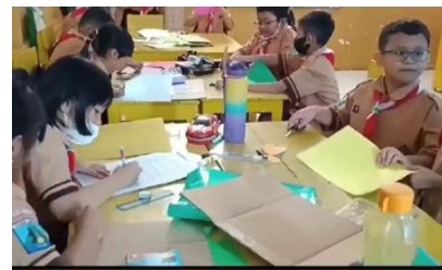
Gambar 7 Pembelajaran di SD Insan Mulya

Selain kesiapan Kepala Sekolah melihat pada kesiapan guru. Guru di SD Insan Mulya Kecamatan Driyorejo Kabupaten Gresik siap dalam melaksanakan apa yang ditugaskan oleh Kepala Sekolah kepada guru-guru. Selain itu guru-guru juga melakukan pembekalan sebelum dan berjalannya sekolah penggerak. Sedangkan untuk kesiapan sarana dan prasarana dalam pelaksanaan sekolah penggerak mendapatkan support dari pemerintah dari BOS kinerja untuk proyektor LCD, chromebook , buku dan bahan ajar.