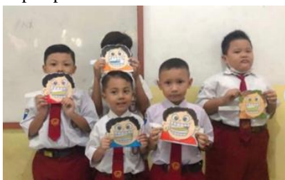
Gambar 4 Pelaksanaan P5 dengan Tema Hidup Sehatku

Kegiatan Proyek Penguatan Profil Pelajar Pancasila diterapkan di SD Insan Mulya kecamatan Driyorejo pada tahun pertama yaitu di kelas 1 dengan kegiatan kerajinan dari botol bekas, dan kelas 4 yaitu kegiatan karya seniku yang bernilai. Sedangkan pada tahun ke-2 kegiatan Proyek Penguatan Profil Pelajar Pancasila yaitu kelas 1 yaitu mengenal lagu daerah, kelas 2 dengan kegiatan permainan tradisional, kelas 4 kegiatan wayang show, dan kelas 5 kegiatan tarian tradisional. Untuk tahun ke-3 kegiatan yang dilakukan pada proyek penguatan profil pelajar Pancasila pada kelas 1 yakni melalui pola hidup sehat, kelas 2 dengan kegiatan berkarya melalui sampah organik, kelas 3 dengan kegiatan asyik berkreasi dengan sampah plastic, kelas 4 dengan kegautan penghijauan kreatif dengan sampah, kegaitan kelas 5 yaitu bumiku rumah sampah, dan kegiatan di kelas 6 yang berupa inovasi kurangi sampah plastik.