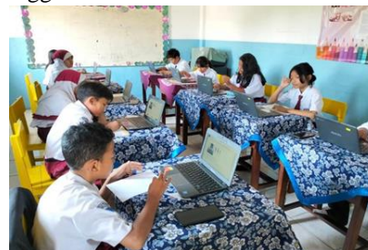
Gambar 5 Pelaksanaan UNBK di SD Insan Mulya

Pada sub indikator apakah kebijakan memang dibuat oleh lembaga yang mempunyai wewenang (Kadji 2015: 78). Di SD Insan Mulya, program sekolah penggerak dibentuk oleh lembaga yang memiliki wewenang dan tupoksi di bidang pendidikan yaitu