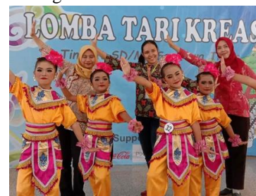
Gambar 8 Lomba Tari

SD Insan Mulya kecamatan Driyorejo Kabupaten Gresik bermitra dengan mahasiswa UNESA berasal dari mahasiswa tari atau mahasiswa seni. Mitra berperan dalam kegiatan ekstrakurikuler. program sekolah penggerak ini juga mengembangkan minat bakat anak dengan mitra yang berasal dari mahasiswa UNESA dalam kegiatan ekstra kurikuler.