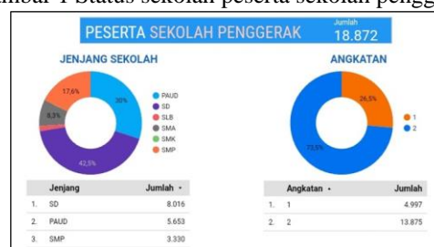
Gambar 1 Peserta Sekolah Penggerak di Indonesia

Berdasarkan data dari laman Kemendikbud untuk saat ini peserta sekolah penggerak yang ada di Indonesia berjumlah 18.872 sekolah. Sekolah penggerak ini dilaksanakan oleh berbagai jenjang baik dari PAUD, SD, SMP, SMA/SMK baik dari sekolah Negeri ataupun sekolah Swasta. Dengan angkatan pertama berjumlah 4.997 sekolah dan angkatan ke-2 adalah 13.875. Hal ini dapat dilihat pada gambar 1. Peserta Sekolah Penggerak dan gambar 1 Status sekolah peserta sekolah penggerak.