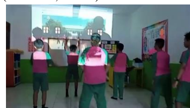
Gambar 3 Pembelajaran Menggunakan Video Pembelajaran

Selain itu dalam pembelajaran guru menggunakan media pembelajaran berupa video pembelajaran yang lebih banyak terdiri dari suara dan gambar. Pembelajaran menggunakan video pembelajaran ini ditunjang dengan menggunakan LCD, proyektor maupun laptop. Hal serupa itu dengan hasil penelitian dari Jumardi Budiman, bahwasannya guru mulai menggunakan media ajar yang memudahkan siswa untuk memahami materi pembelajaran. Contohnya, guru menggunakan gambar yang dicetak lalu ditempelkan di papan tulis dan menggunakan proyektor (Budiman,2022:6).