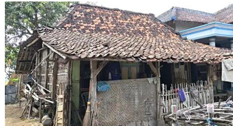
Gambar 1. Kondisi Rumah Tidak Layak Huni di Kabupaten Ponorogo

Kabupaten Ponorogo telah menggenjarkan program Rehabilitasi Rumah Tidak Layak Huni (RTLH) melalui skema Bantuan Stimulan Perumahan Swadaya (BSPS) dimulai sejak tahun 2017 yang memiliki sasaran utama yaitu Masyarakat Berpenghasilan Rendah (MBR). Masing-masing daerah di Kabupaten Ponorogo masih terdapat sejumlah rumah warga yang tergolong tidak layak huni dan memerlukan intervensi dari pemerintah daerah.