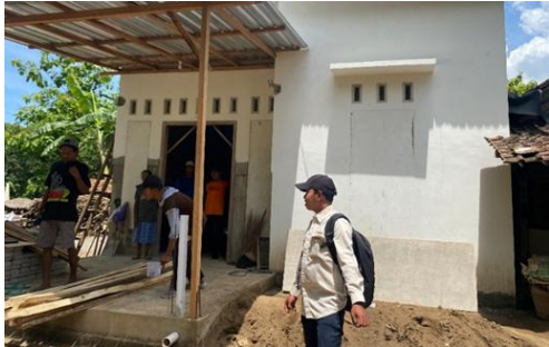
Gambar 6. Pemantauan Progress Pembangunan RTLH

mekanisme program, sementara permasalahan administrasi seperti identitas diri yang tidak lengkap dan status kepemilikan tanah turut menghambat proses pelaksanaan. Kondisi ini menunjukkan bahwa meskipun jalur komunikasi telah tersedia, efektivitas penyampaian informasi masih perlu ditingkatkan, khususnya dalam menjangkau kelompok masyarakat dengan keterbatasan administratif dan pemahaman.