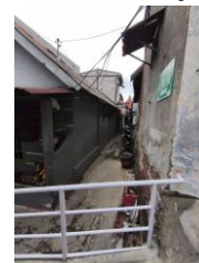
Gambar 3 Akses Jalan Lokasi Penelitian

Tingkat konflik dalam implementasi program juga tergolong rendah. Temuan penelitian menunjukkan bahwa meskipun terdapat dinamika lapangan seperti perubahan data penerima manfaat, keterbatasan partisipasi warga, serta kendala akses jalan sempit di permukiman padat, kondisi tersebut tidak berkembang menjadi konflik kepentingan antar aktor. Perubahan data penerima manfaat terjadi akibat verifikasi ulang dan penyesuaian prioritas berdasarkan kondisi rumah yang lebih mendesak, bukan karena intervensi politik atau tekanan kelompok tertentu. Keterbatasan partisipasi warga lebih dipengaruhi oleh faktor ekonomi dan kesibukan kerja, bukan bentuk penolakan dengan kondisi fisik lingkungan yang mempengaruhi teknis distribusi material, yang kemudian diatasi melalui penyesuaian metode kerja oleh pelaksana. Temuan-temuan ini menunjukkan bahwa dinamika lapangan berada pada ranah operasional dan administratif, bukan konflik struktural yang memengaruhi arah kebijakan.