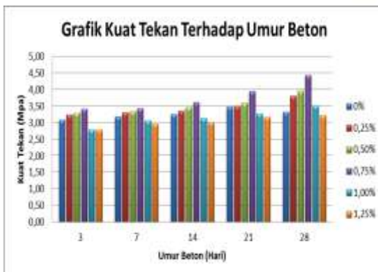
Gambar 4. Grafik Hubungan Kuat Tekan dengan Waktu Pengeringan

Hasil data hubungan kuat tekan dengan waktu pengeringan pada benda uji beton dengan serat rami dapat dilihat pada gambar dibawah ini.