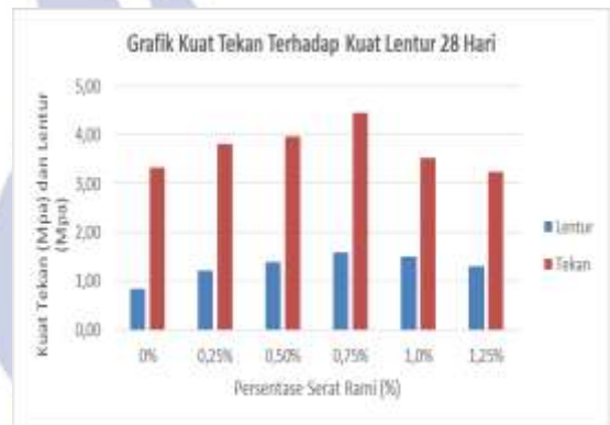
Gambar 5. Grafik Hubungan Kuat Tekan Terhadap Kuat Lentur

Hasil data hubungan kuat tekan terhadap kuat lentur pada benda uji beton dengan serat rami dapat dilihat pada gambar dibawah ini.