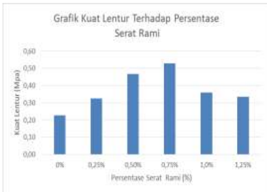
Gambar 3. Grafik Kuat Tekan Rata-Rata Beton Dengan Penambahan Serat Rami

Hasil data dari pengujian kuat lentur balok rata-rata pada benda uji beton dengan serat rami dapat dilihat pada gambar dibawah ini.