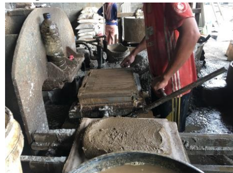
Gambar 4. Proses Pencetakan Genteng Beton

Adukan bahan penyusun genteng beton yang telah dicampur kemudian dimasukkan kedalam cetakan genteng menggunakan cetok, kemudian dipress sehingga menjadi genteng beton flat. Pencetakan dilakukan berulang kali sampai benda uji tercukupi. Proses pencetakan dapat dilihat pada Gambar 4.