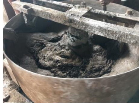
Gambar 3. Proses Pencampuran Bahan

sudah sama. Tahap berikutnya ialah menambahkan air \pm 75\% dari total air yang dibutuhkan, lalu dicampur, diratakan dan sisa air yang dibutuhkan ditambahkan sedikit demi sedikit sambil diaduk kemudian dicampur sampai rata (homogen). Proses pencampuran bahan dapat dilihat pada Gambar 3.