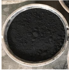
Gambar 2. Abu Ampas Tebu

AAT didapat dari hasil pengabuan ampas tebu di pabrik gula Candi, Sidoarjo. Setelah proses pengambilan, dilakukan proses pengeringan abu menggunakan oven selama 24 jam dengan suhu 1000°C. Selanjutnya dilakukan pemeriksaan analisa lolos ayakan No.200. AAT bisa dilihat pada Gambar 2.