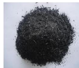
Gambar 1. Abu Sekam Padi

ASP didapat dari hasil pembakaran bata merah yang berlokasi di jl. Mojosari. Selanjutnya dilakukan pemeriksaan analisa lolos ayakan No.200. Abu sekam padi (ASP) bisa dilihat pada Gambar 1.