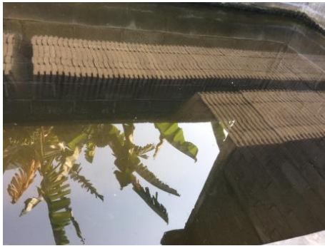
Gambar 5. Proses Perendaman Genteng Beton

0096:2007. Pada gambar 5 dapat dilihat bagaimana proses perendaman genteng beton.