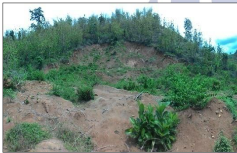
Gambar 2. Lokasi Longsorlahan di Desa Ngrimbi

Berikut adalah gambar peta kondisi ketinggian tubuh longsor yang terjadi di Desa Ngrimbi seperti pada gambar 3 :