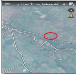
Gambar 1. Citra Satelit Wilayah Longsorlahan

Menurut data tingkat bahaya erosi dan longsor Kabupaten Jombang di Kecamatan Bareng terdapat 304,35 ha wilayah yang berpotensi erosi dan longsor dengan kategori sangat berat dan 617,41 ha dengan kategori berat dari keseluruhan luas wilayah 921,76 ha. Gambar 1 merupakan citra satelit wilayah longsorlahan dan gambar 2 merupakan lokasi terjadinya longsorlahan didusun koppen Desa Ngrimbi Kecamatan Bareng.