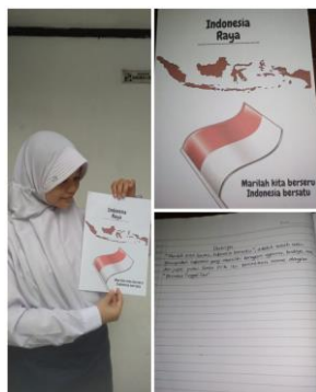
Gambar 7. Puspa Widiyanti, ukuran :21cm x 29cm (A4) Media : Bolpoint dan Oil Pastel. (Sumber: Dokumen Yuli Prasetyo,2020)

dan negara. Sudah paham mengenai makna yang terkandung dalam syair lagu. Dan sangat bisa sebagai medium untuk membangkitkan rasa nilai-nilai nasionalisme pada anak usia remaja.