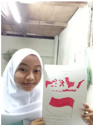
Gambar 5. Naura Bilqis, ukuran :21cm x 29cm (A4) Media : Bolpoint dan Oil Pastel.

Objek yang digambar murid kebanyakan adalah pulau jawa dan bendera merah putih. Hal tersebut menunjukkan bahwa bagi anak bendera merah putih merupakan sesuatu yang paling berkesan ketika peringatan hari kemerdekaan Indonesia. Berikut contoh penggambarannya.