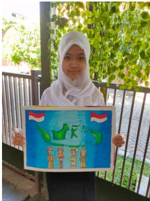
Gambar 3. Nurin Anindya, ukuran :42cm x 29cm (A3) Media : Pensil dan Oil Pastel.