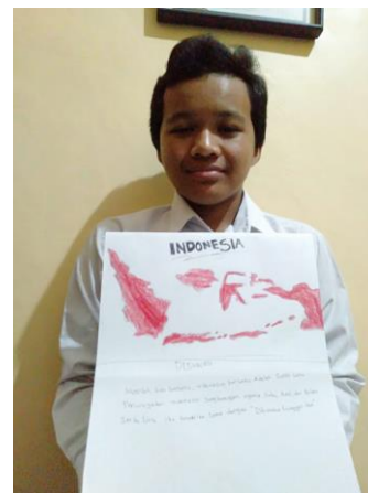
Gambar 6. Aril Okta, ukuran :29cm x 42cm (A3) Media : Bolpoint dan Oil Pastel.

Gambar ilustrasi murid kelas VII E SMPN 17 sebgaiian besar penggambaran unsur garis sudah terkontrol sehingga membentuk bidang-bidang yang dapat dikenali sesuai objek yang ingin di gambar anak. Warna-warna yang digunakan anak merupakan warna objek sesuai dengan kenyataan, warna berdasarkan. Berikut penggambarannya.