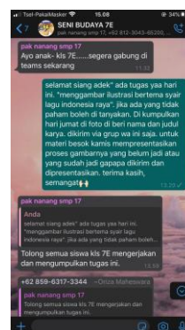
Gambar 1. Pelaksanaan pembelajaran menggambar ilustrasi melalui grup WhatsApp wali kelas dan murid.

menggambar ilustrasi dapat dilihat pada gambar berikut :