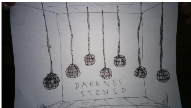
Gambar. 7 Sketsa

Gambar sketsa karya yang berjudul Darknes Stoned . Karya ini menggunakan bahan batu, tali tampar dan kawat berduri.