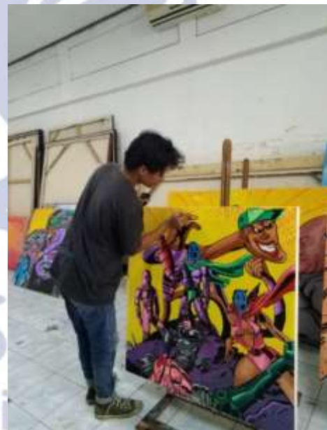
Gambar 1. (Proses pembuatan seni lukis )