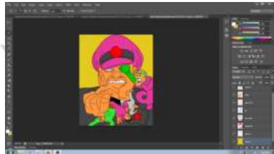
Gambar 10. (Proses Pewarnaan Pada tahap kedua)