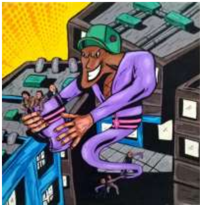
Gambar 7 (Karya seni lukis ke tuju)

Judul : kemenangan Ukuran : 100cm X 100cm Bahan : akrilik pada Kanvas Tahun : 2018