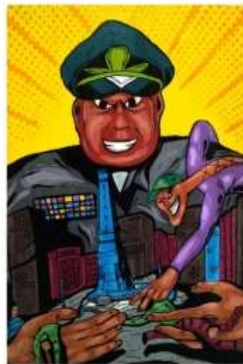
Gambar 6 .(Karya seni lukis ke lima)

Judul : Kerja sama Ukuran : 70 cm X 100cm Bahan : akrilic pada Kanvas Tahun : 2018