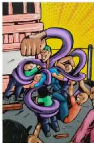
Gambar 4. (Karya seni lukis ke ketiga)

Judul : Strategi Satu Ukuran : 70 cm X 100cm Bahan : akrilic pada Kanvas Tahun : 2018