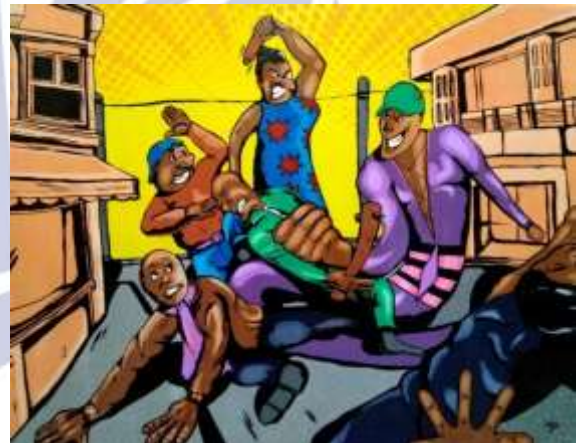
Gambar 3. (Karya seni lukis ke kedua)

Judul : Langkah pertama Ukuran : 130 cm X 100cm Bahan : akrilik pada Kanvas Tahun : 2018