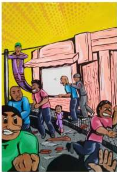
Gambar 5 (Karya seni lukis ke empat)

Judul : Balas dendam Ukuran : 70 cm X 100cm Bahan : akrilic pada Kanvas Tahun : 2018