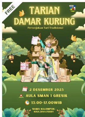
Gambar 4. Contoh Poster dengan Skor Tinggi Kelompok Kontrol

Karya dengan skor tinggi dengan nilai 90,6 pada kelompok kontrol menunjukkan kreativitas dan orisinalitas yang lebih menonjol, meskipun masih terdapat keterbatasan pada aspek teknis seperti warna dan tipografi.