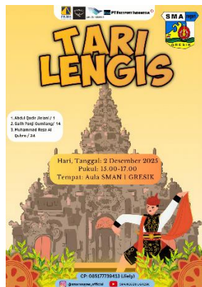
Gambar 5. Contoh Poster dengan Skor Rendah Kelompok Kontrol

Karya dengan skor tinggi dengan nilai 90,6 pada kelompok kontrol menunjukkan kreativitas dan orisinalitas yang lebih menonjol, meskipun masih terdapat keterbatasan pada aspek teknis seperti warna dan tipografi.