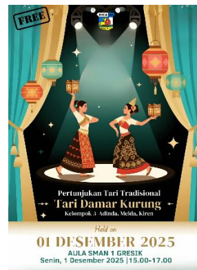
Gambar 3. Contoh Poster dengan Skor Rendah Kelompok Eksperimen

Poster tersebut merupakan salah satu contoh karya dengan skor tinggi, yaitu dengan perolehan nilai 96,9 pada kelompok eksperimen memiliki tata letak yang seimbang, komposisi yang terstruktur, serta kesesuaian tema yang kuat.