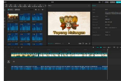
Gambar 4. Proses Editing Video (Sumber: Zea Adya. 2025).

Pada tahap akhir, seluruh elemen seperti ilustrasi, animasi, narasi suara, teks, transisi, dan musik latar digabungkan menggunakan aplikasi CapCut. Proses editing dilakukan untuk memastikan keselarasan antara visual dan audio. Selain itu, dilakukan revisi berupa perbaikan ilustrasi, penambahan narasi, serta penyempurnaan transisi. Hal ini menunjukkan bahwa proses revisi memiliki peran penting dalam meningkatkan kualitas media pembelajaran.