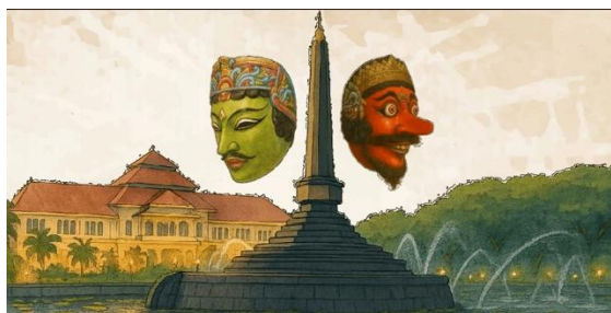
Gambar 5. Tampilan Isi Video Cerita Bergambar.

mayoritas peserta didik mengalami peningkatan yang baik. Dengan demikian, media yang dikembangkan terbukti efektif sebagai sarana pembelajaran dan edukasi budaya.