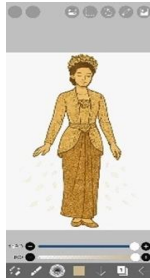
Gambar 2. Proses Membuat Ilustrasi (Sumber: Zea Adya. 2025).

dilakukan untuk menentukan bentuk dasar karakter, kemudian dilanjutkan dengan line art untuk memperjelas detail sesuai dengan konsep budaya Topeng Malang. Pemilihan warna dan bentuk disesuaikan dengan makna simbolik masing-masing tokoh. Hal ini menunjukkan bahwa aspek visual tidak hanya berfungsi sebagai estetika, tetapi juga sebagai penyampai makna budaya.