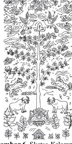
Gambar 6. Sketsa Kelompok 1

terlihat cukup penuh dengan memasukkan 6 (enam) ornamen yaitu pohon Kalpataru , burung, harimau, kerbau, kepala raksasa, dan rumah. Motif tambahan berupa tumbuhan-tumbuhan dan motif mega mendung.