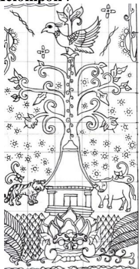
Gambar 9. Sketsa Kelompok 1

Sketsa ini memasukkan 6 (ornamen) berupa burung, pohon Kalpataru , harimau, kerbau, rumah, dan kepala raksasa. Motif tambahan berupa bunga-bunga bertebaran dan di samping kanan dan kiri kepala raksasa diberikan Isen-isèn berupa garis bergelombang.