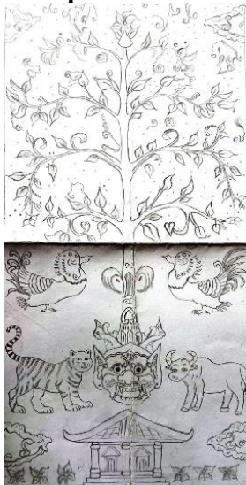
Gambar 5. Sketsa Kelompok 1

mengeksplorasi ornamen sebanyak 6 (enam) diantaranya pohon Kalpataru , burung, kepala raksasa, harimau, kerbau, dan rumah. Terdapat motif tambahan dengan memasukkan motif mega mendung dibagian atas dan bawah serta ditambahkan bunga kecil dibagian bawah secara sejajar.