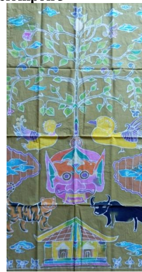
Gambar 17. Hasil kelompok 3

Motif utama terlihat kepala raksasa yang besar ditengah didampingi dua burung berwarna kuning, dibagian bawah terdapat harimau, kerbau dan rumah. Isen-isen pada desain ini terlihat sedikit dibandingkan banyaknya eksplorasi ornamen dan motif tambahan. Struktur motif batik pada desain ini adalah kepala raksasa sebagai point of interest motif utama memiliki simbol kala yang berarti waktu dalam bahasa Jawa, motif tambahan yaitu terdapat awan atau motif mega mendung melambangkan dunia atas untuk memberikan keteduhan.