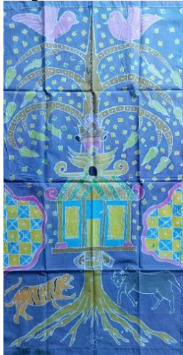
Gambar 15. Hasil kelompok 1

membuat batik menggunakan warna ungu sebagai latar belakangnya, ornamen diberi warna beragam seperti pink untuk burung, coklat untuk menggambarkan batang pohon Kalpataru , rumah dan motif tambahan diberi warna biru dan kuning, dan untuk warna harimau dan kerbau diberi warna seperti hewan aslinya. Motif utama dalam desain ini adalah rumah yang menyatu dengan pohon kalpataru menjulang tinggi dan bercabang dibagian atas, motif tambahan berupa motif yang hamper mirip kawung namun terdapat sulur yang bergelombang sehingga membentuk seperti kawung. Isen-isen yang mengisi diantaranya titik, garis-garis, dan sedikit ukel pada atap rumah.