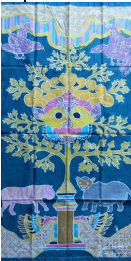
Gambar 19. Hasil kelompok 5

Diberi warna biru tua untuk menonjolkan motif, pada bagian pohon Kalpataru berwarna kuning keemasan dan kepala raksasa yang besar diberi warna kombinasi kuning, merah muda, dan biru. Harimau berwarna merah muda, kerbau diberi warna abu-abu dan dibagian atas dan bawah ditambahkan motif kawung. Motif utama adalah kepala raksasa yang besar melambangkan pentingnya mengingat waktu, motif tambahan terdapat motif kawung dibagian atas dan bawah, pohon kalpataru berwarna kuning keemasan diartikan sumber kehidupan, perlindungan dan perkembangan kehidupan manusia yang dilihat dari ranting lebar.