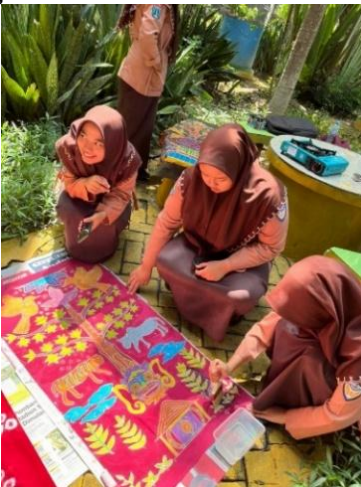
Gambar 13. Penguncian warna

Penguncian warna menggunakan cairan yang bernama waterglass . Kain yang sudah diberi cairan waterglass selanjutnya dikeringkan dengan cara diangin-anginkan selama kurang lebih 12 jam.