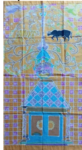
Gambar 20. Hasil kelompok 6

Pohon Kalpataru membentuk lambing wajik dengan harimau yang warnanya hamper menyerupai latar belakang dan kerbau berada di dalamnya, bagian bawah terdapat rumah yang cukup besar dengan kepala raksasa di atasnya, bagian samping kanan dan kiri ditambahkan motif bunga kecil yang disusun seperti jaring besar. Motif utama desain ini adalah rumah besar dengan motif kotak-kotak pada latar melambangkan tempat yang nyaman dan memberikan keamanan sebagai perlindungan dari hal-hal buruk.