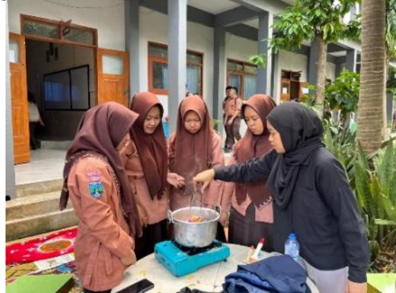
Gambar 14. Pelorodan

Tahapan ngelorod atau perebusan kain untuk melepaskan lilin yang menempel agar motif yang dibuat terlihat aslinya.