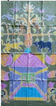
Gambar 16. Hasil kelompok 2

Hewan pada batik ini diwarnai seperti warna aslinya seperti burung merak, harimau, kerbau, dan kerbau. Ornamen rumah, raksasa kembar, dan bledegan diwarnai senada agar terlihat memiliki kesinambungan. Desain ini memiliki motif utama berupa rumah yang besar dengan banyak tiang yang melambangkan keamanan. Motif tambahan pohon yang diartikan sebagai hubungan antara manusia dengan alam serta tuhan, harimau dan banteng diartikan kekuatan fisik.