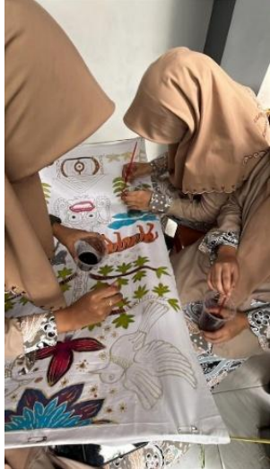
Gambar 12. Pewarnaan

kain yang sudah selesai dicanting diwarnai dengan pewarna remasol dengan teknik colet menggunakan alat yaitu kuas. Kain diwarnai dengan posisi dibentangkan menggunakan tali rafia dan peniti di tempat yang sudah disiapkan di depan kelas.