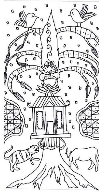
Gambar 3. Sketsa Kelompok 1

Sketsa motif batik telah mengeksplorasi 6 ornamen Wayang Gunung yaitu pohon Kalpataru , kerbau, harimau, rumah, burung, dan kepala raksasa. Kemudian ditambahkan motif tambahan dan Isen-isen .