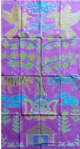
Gambar 18. Hasil kelompok 4 (Sumber: Dok. Nurinda Desilia Putri, 2025)

Terdapat perbedaan dari sketsa pola dikertas dan pengaplikasian pada kain yaitu dibagian jumlah harimau dan kerbau. Pada sketsa jumlah harimau dan kerbau masing-masing ada dua dengan posisi berhadapan, namun pada pengaplikasian dikain kelompok 3 hanya memasukkan masing-masing hanya seekor. Kepala raksasa yang berada di bawah pohon diartikan sebuah sumber berasal dari dalam, dan rumah menjadi tempat untuk bersinggah demi ketenangan dan keamanan dalam keluarga, sehingga desain ini memberikan makna kasih sayang dan kebahagiaan dalam hidup.