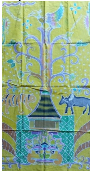
Gambar 21. Hasil kelompok 7

terlihat kurang padat dibandingkan kelompok yang lainnya, namun sudah memasukkan 6 ornamen Wayang Gunungan. Bagian bawah ada kepala raksasa dan rumah, pohon Kalpataru yang di atasnya hanya ada seekor burung bersayap warna-warni dan hewan harimau serta kerbau diberi warna seperti warna asli. Motif utama adalah kepala raksasa di bagian bawah melambangkan waktu, motif tambahan pohon kalpataru dengan ranting lebar melambangkan kehidupan, harimau dan kerbau memiliki makna keseimbangan hubungan, rumah menambahkan keamanan dan ketenangan.