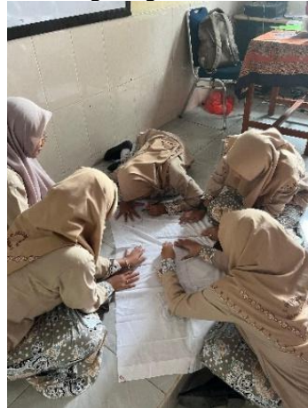
Gambar 10. Memindahkan pola pada kain

Tahap ini adalah tahap pembagian kain mori berukuran 100cm x 50cm dan dilanjutkan dengan memindahkan sketsa pola pada kain dengan menggunakan pensil.