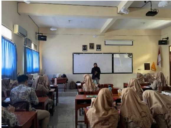
Gambar 1. Pemaparan Materi

Tahapan ini adalah pengenalan kemudian dilanjutkan dengan menjelaskan maksud dan tujuan kedatangan, pemaparan materi, pembagian kelompok dan lembar instruksi.