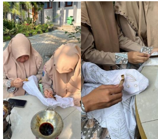
Gambar 11. Mencanting

Tahapan diawali dengan menyiapkan alat dan bahan untuk proses mencanting, untuk membatik di SMAN 2 Lamongan menggunakan kompor batik dengan canting klowong dan cecek . Pada