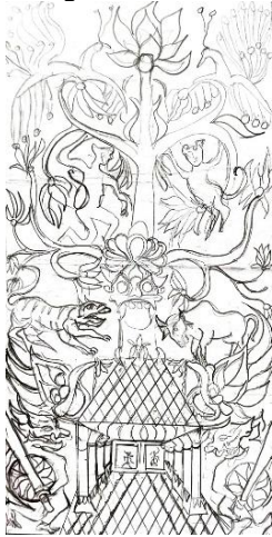
Gambar 4. Sketsa Kelompok 2

Ornamen yang dieksplorasi terdiri dari pohon Kalpataru , kera, kepala raksasa, harimau, kerbau, rumah, burung, dan raksasa kembar. Sketsa kelompok 2 ini menggunakan total 8 (delapan) ornamen hasil dari eksplorasi.