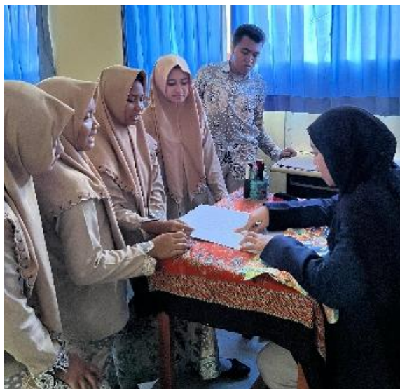
Gambar 2. Konsultasi desain (Sumber: Dok. Nurinda Desilia Putri, 2025)

Peserta didik berkumpul sesuai dengan kelompok untuk mendiskusikan ornamen yang akan digunakan dalam desain motif batik dan dilanjutkan menggambar sketsa pola sebelum dikonsultasikan pada peneliti. sketsa pola yang sudah jadi kemudian dikonsultasikan, peserta didik menjelaskan konsep desain motif batik yang dibuat kepada peneliti sehingga peneliti mengetahui dan memeriksa kesesuaian dengan lembar instruksi. Berikut adalah sketsa pola eksplorasi ornamen Wayang Gunung sebagai ide desain motif batik kelas XI-2 SMA Negeri 2 Lamongan.