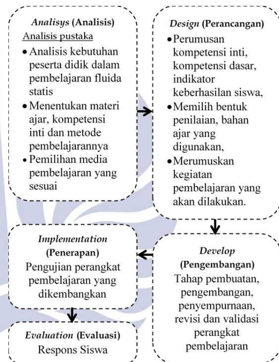
Gambar 1. Alur Penelitian

Pengembangan perangkat dilakukan melalui 5 tahap yaitu Analysis, Design, Develop, Implementation, Evaluation yang dirinci pada bagan berikut: