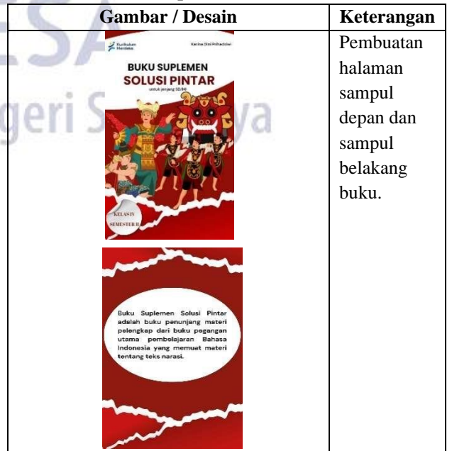
Tabel 7. Gambar Pengembangan Buku Suplemen Solusi Pintar

Tahap pengembangan ( development ) pada tahap ini dilakukan 2 kegiatan yaitu mengembangkan buku suplemen solusi pintar dan melakukan uji validitas. Proses pengembangan dilakukan setelah dilakukannya perencanaan desain gambar. Desain yang telah dibuat kemudian diedit menggunakan aplikasi canva sehingga berbentuk buku. Adapun desain akhir buku suplemen solusi pintar yaitu pada tabel 6, sebagai berikut.