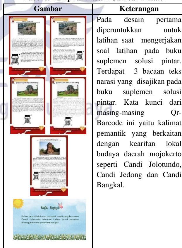
Tabel 6. Tampilan Desain Gambar Kesatu

Tahap perancangan ( design ) pada tahap awal perancangan yaitu dilakukan merancang suatu desain media pada buku suplemen solusi pintar. Terdapat tiga desain gambar yang digunakan dalam pembelajaran membaca pemahaman teks narasi. Desain tersebut disesuaikan untuk siswa sekolah dasar baik dari segi gambar, desain, isi dan warna gambar. Adapun desain buku suplemen solusi pintar yang digunakan dalam pembelajaran membaca pemahaman teks narasi yaitu pada tabel 6.