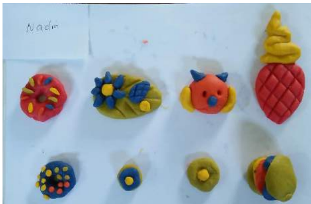
Gambar 11. Hasil Karya Nadin saat Siklus II