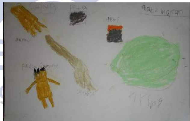
Gambar 3. Hasil Karya Aini saat Pretes