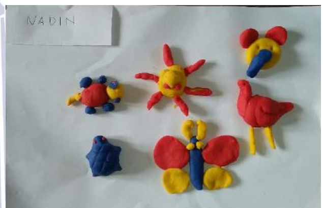
Gambar 8. Hasil Karya Nadin saat Siklus II