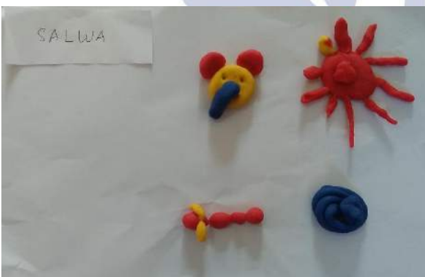
Gambar 6. Hasil Karya Salwa saat Siklus I