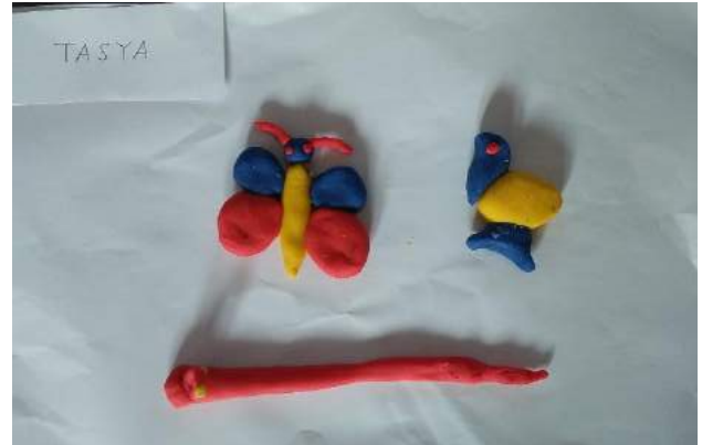
Gambar 7. Hasil Karya Tasya saat Siklus I