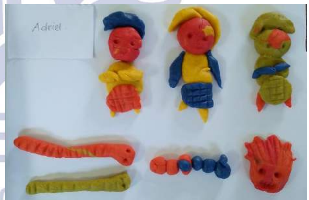
Gambar 9. Hasil Karya Adriel saat Siklus I