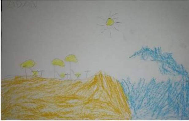
Gambar 4. Hasil Karya Zidan saat Pretest