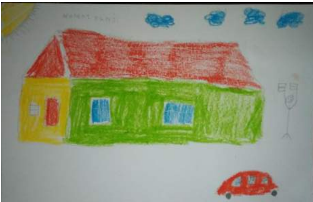
Gambar 5. Hasil Karya Panji saat Pretest