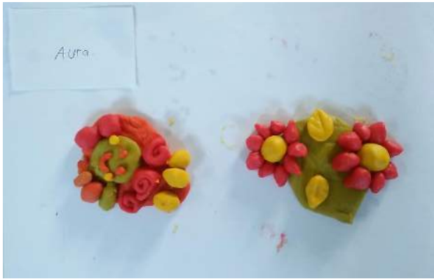
Gambar 10. Hasil Karya Aura saat Siklus II