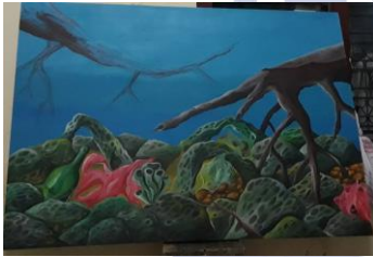
Gambar 4.8 Proses pewarnaan Objek