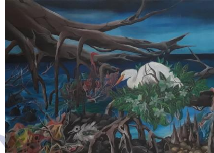
Gambar 4.14 Karya keempat