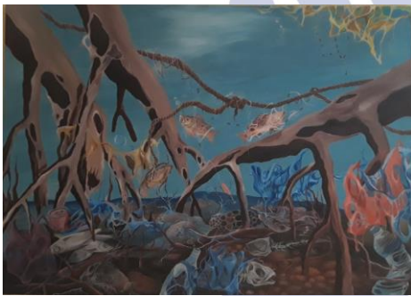
Gambar 4.12. Karya kedua (dok. Penulis 2019)