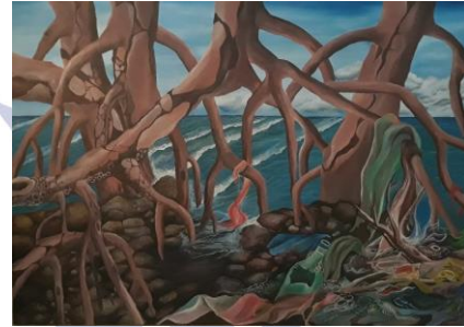
Gambar 4.11 Karya pertama