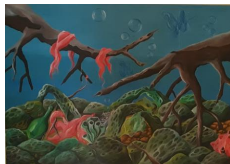
Gambar 4.13 Karya ketiga (dok. Penulis 2019)