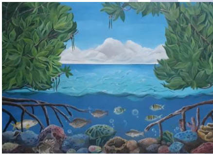
Gambar 4.15 Karya kelima (dok. Penulis 2019)