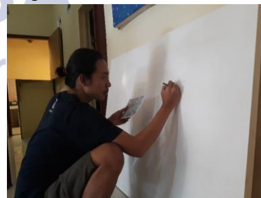
Gambar 4.6 Pemindahan desain sketsa kedalam media kanvas

Peggelobalan merupakan tahapan tahapan dalam perwujudan karya oleh penulis dengan memindakan desain sketsa ke dalam media kanvas. Pada proses peggelobalan ini penulis menggunakan pensil atau krayon. Jika tahap peggelobalan sudah dilakukan, barulah penulis mulai proses pewarnaan.