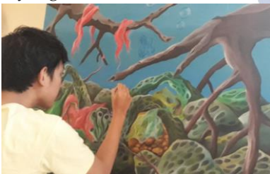
Gambar 4.9 Proses pendetailan

Tahap proses pendetailan ini penulis lebih menggunakan kuas yang berukuran lebih kecil agar objek yang digambar nampak ektetis dan lebih jelas atau detail seperti menggambar objek tumbuhan-tumbuhan mangrove juga batang dan akar mangrove yang rumit.