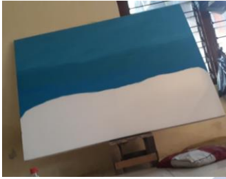
Gambar 4.7 Proses pewarnaan Background

pewarnaan objek sesuai dengan sketsa awal yang dibuat. Berikut gambar proses pewarnaan :